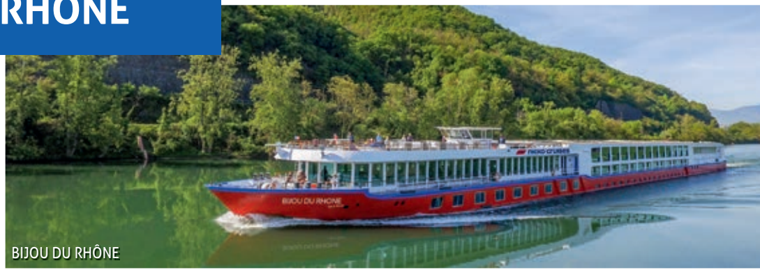
BIJOU DU RHÔNE