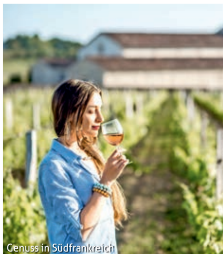
Genuss in Südfrankreich