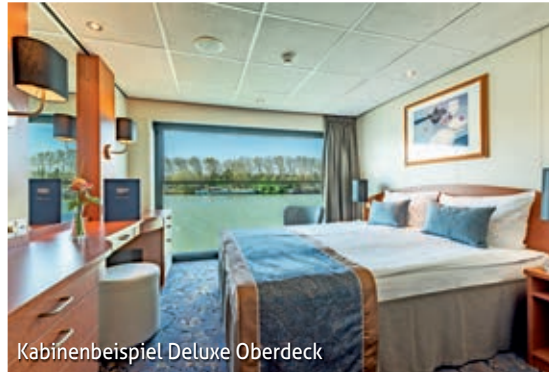
Kabinenbeispiel Deluxe Oberdeck