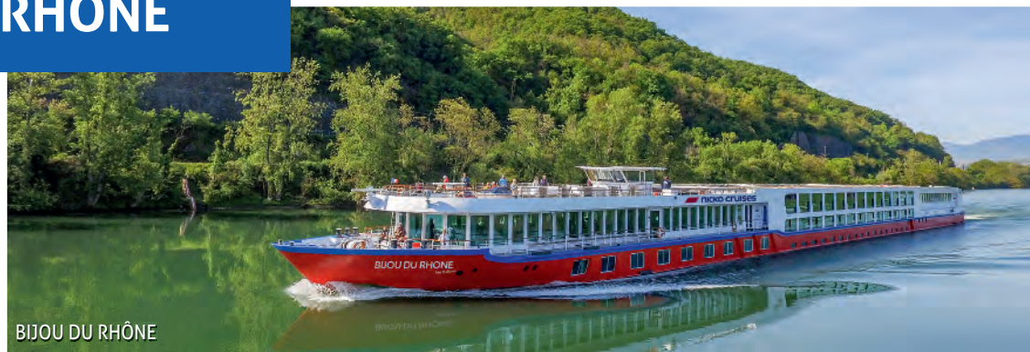
BIJOU DU RHÔNE