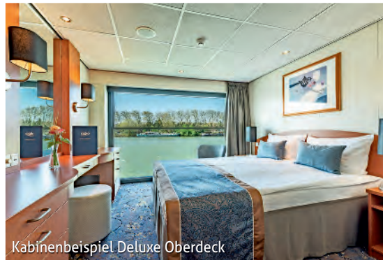
Kabinenbeispiel Deluxe Oberdeck